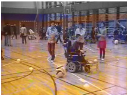
停止したボールの左右打ち分け 2