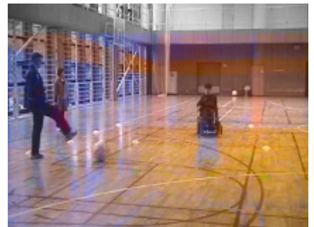
移動するボールを前打ち