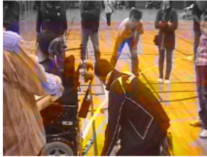
後方視野の狭角測定(ボール停止時)2