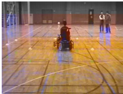
前進→旋回→後進→旋回→前進の動作確認