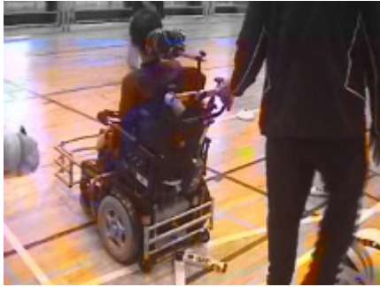
後方視野の狭角測定(ボール停止時)1