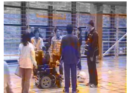
クリニックの様子 3