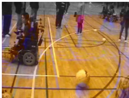
後方視野の狭角測定(ボール移動時)2