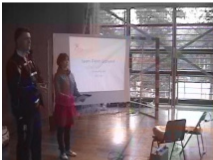
クリニックの様子 1