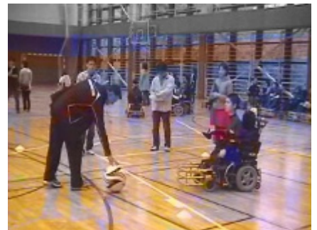
停止したボールの左右打ち分け 1