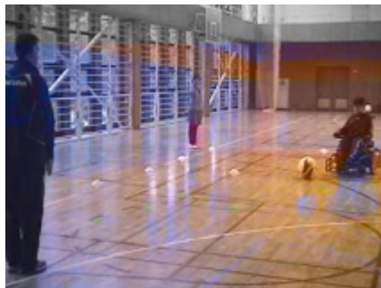
停止したボールの左右打ち分け 3