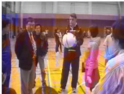
クリニックの様子 5