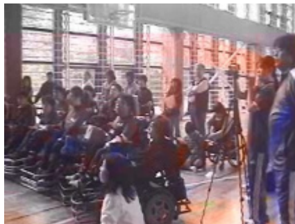
クリニックの様子 2