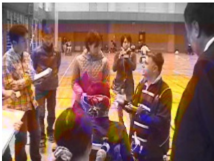
クリニックの様子 4