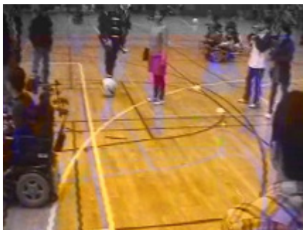
後方視野の狭角測定(ボール移動時)1