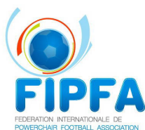
FIPFA ロゴ 国際電動車椅子サッカー連盟